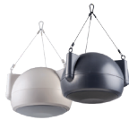
Altavoces Colgantes Orbit OPS1