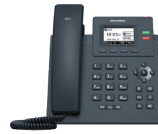
Teléfono Bogen Nyquist con Pantalla LCD NQ-T2000