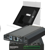
Intercomunicador VoIP Para Plenum Nyquist NQ-GA10P con CSD2X2U-V2