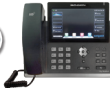
Teléfono Admin VoIP Pantalla Táctil Color Nyquist NQ-T1100